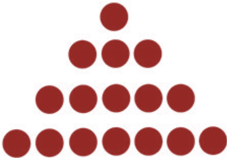
Nim Oyunu Başlangıç Dizilimi