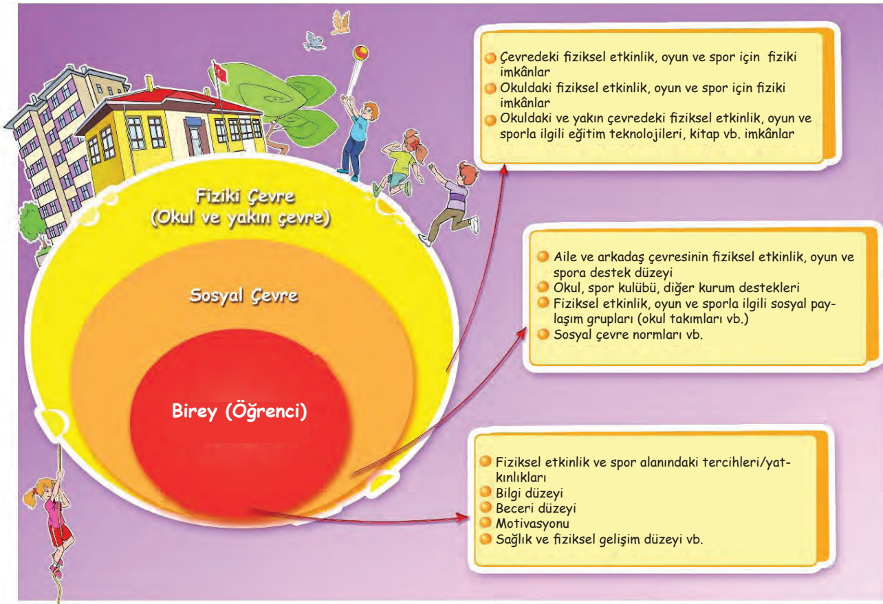
Şekil 1. Okula özgü düzenlemelerde incelenmesi gereken temel unsurlar

Bu Program'daki çıktılara ulaşmak için öğretmenler, öğrencilerin bireysel özellikleri ile sosyal ve fiziksel çevrelerinin özellikleri doğrultusunda uyarlamalar yapmalıdırlar. Örneğin öğretmenler etkinlik seçimi ve uygulamalarında okul çevresinin sosyal, kültürel durumu, veli beklentileri ve hassasiyetleri dikkate alınarak modern danslar yerine halk danslarına yer verebilirler. Bu amaçla eğitim öğretim yılı başında öğretmenlerin Şekil 1'de belirtilen her bir boyutu gözden geçirerek düzenlemeler yapmaları önerilir.