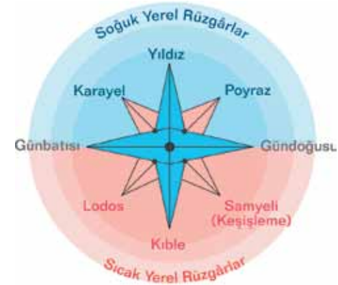
Resim 1: Soğuk ve Sıcak Yerel Rüzgârlar

Ülkemizde rüzgârlardan en çok bilineni kuzeydoğudan esen poyraz ve güneybatıdan esen lodostur. Lodos, dağlardaki karların hızla erimesine yol açarak sellere de neden olabilir (Resim 1). Ayrıca lodoslu havalarda soba zehirlenmesi ülkemizde sık rastlanan bir olaydır.