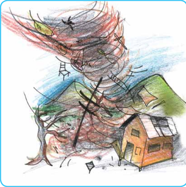
Resim 4 : Hortum

Hortumlar, doğanın en şiddetli rüzgâr fırtınalarındandır. Hortumlar; küçük, güçlü ve alçak basınç alanlarında, hızlı bir şekilde kendi ekseninde dönen rüzgârlardır. Hortumların oluşumu, her zaman huni şeklini almış bir bulut ile başlar. Bu huni bulut, bir filin hortumuna benzer. Şiddetli gök gürültüleri ile birlikte dönerek ilerleyen huni bulut ancak yerle temas ettikten sonra hortum olarak adlandırılır (Resim 4).